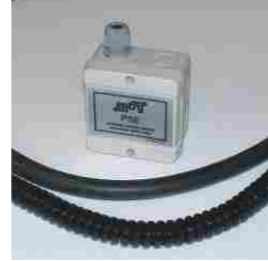
Pnömatik emniyet sistemi