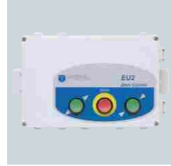
400 Vac motorlar için kontrol ünitesi