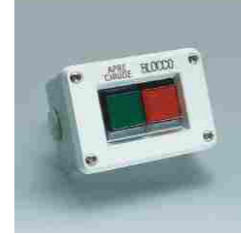
Harici Tip Buton