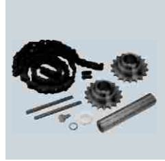
Ayna Dişlisi İle Birlikte Ara Mil