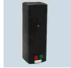
400 Vac motorlar için kontrol ünitesi