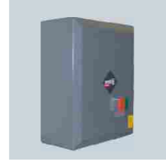
220 Vac motorlar için kontrol ünitesi