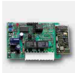
Radio Alıcı Kartı