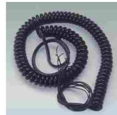
FLEXY 6 Kablo