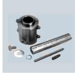
Halat Sarma Mili Adaptörü, Ø 30 / 31,75 / 40 mm