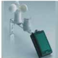
Rüzgar ve Yağmur Sensörü